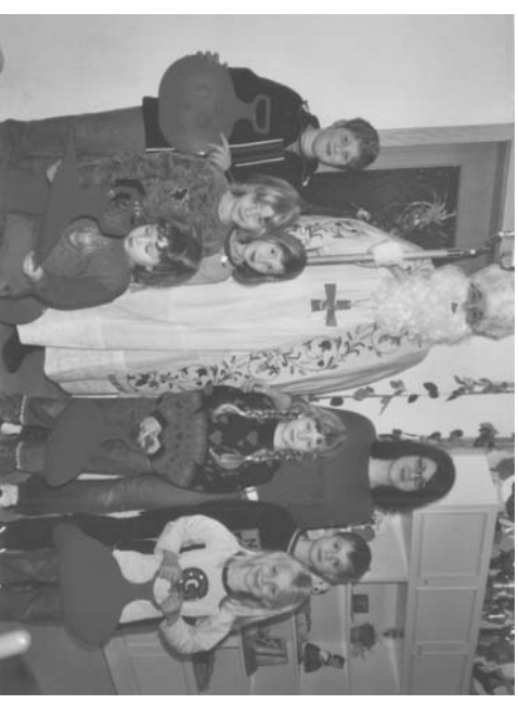
Bischof Nikolaus besuchte die Kinder bei der Weihnachtsfeier der „Spielschar-Minis“ im Ellwanger Vereinsheim am Schönen Graben.

!!! Achtung: Aus technischen Gründen ist der Einsendeschluss der 1. des Vormonats !!! e-mail: ianuschko@t-online.de